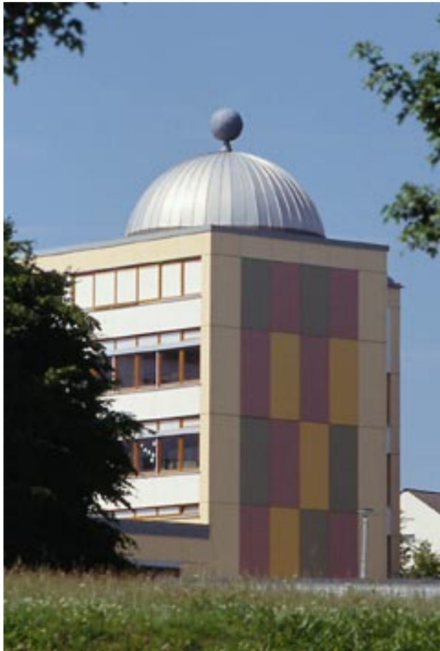
Volkssternwarte Planetarium Diedorf